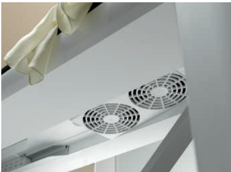
Table à repasser active

La table à repasser active a un ventilateur capable de souffler et d'aspirer. Grâce à la fonction marche/arrêt automatique, le ventilateur s'enclenche dès que vous appuyez sur la touche vapeur du fer à repasser. Et si vous faites une brève pause repassage, il s'arrête automatiquement au bout d'un court laps de temps. La fonction Mémoire retient si vous avez travaillé avec la fonction de soufflerie ou d'aspiration et règle la fonction utilisée en dernier lieu lorsque vous rappuyez sur la touche vapeur. La commutation entre les deux fonctions est toute simple grâce à une pression sur la touche correspondante sur le fer à repasser.