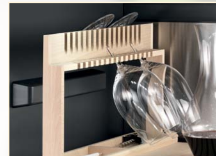
Uchwyt na kieliszki

Dopełnieniem idealnie dojrzałego wina w chłodziarce Miele jest niewątpliwie dekanter ..... oraz wysokiej jakości kieliszki, które pozwolą na wydobyć pełnego bukietu smaku i aromatu winnego trunku. Aby w pełni delektować się wyśmienitym winem Miele poleca dekantery i kieliszki firmy Riedel.