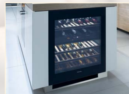
Przyciemniony szklany front

Firma Riedel - znany na całym świecie austriacki producent szkła, kieliszków oraz dekanterów- wytwarza wysokiej jakości produkty doceniane przez koneserów wina. Riedel oferuje szeroką gamę kieliszków dedykowanych konkretnym odmianom szczepów winnych. Jego produkty wytwarzane ręcznie, maszynowo, czy dmuchane ustami wywierają ogromny wpływ na światową kulturę winiarską.