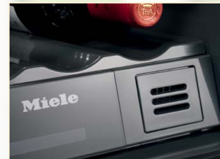
Filtr Active AirClean